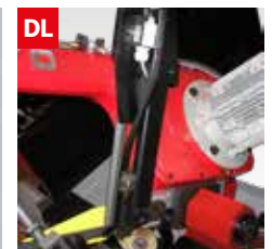
Dispositivo controllo deviazione lama Blade deflection control device

Segatrice a nastro semiautomatica con arco e morsa a comando oleodinamico, discesa e salita rapida controllata da tastatore e avanzamento di taglio con regolazione infinitesimale. Doppio pulsante di sicurezza per avviamento ciclo e impianto elettrico in bassa tensione secondo norme CE. La segatrice può essere fornita con rulliere e relativi accessori.