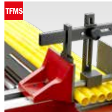
Taglio fascio meccanico Mechanical bundle clamping device