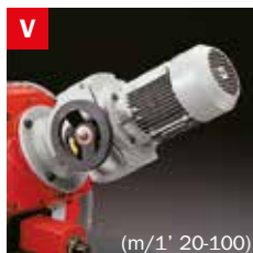
Motovariatore Blade speed variator