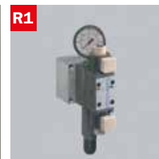
Reg. pressione morse Adjustable vice pressure