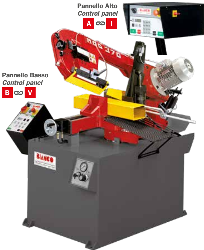
Pannello Alto Control panel