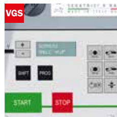
Visualizzatore gradi angolo di taglio Cutting angle display