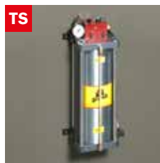
Dispositivo taglio a secco Dry cooling device