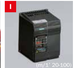
Inverter Frequency converter